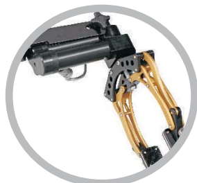
可更换手爪触点，抓取更准确稳定