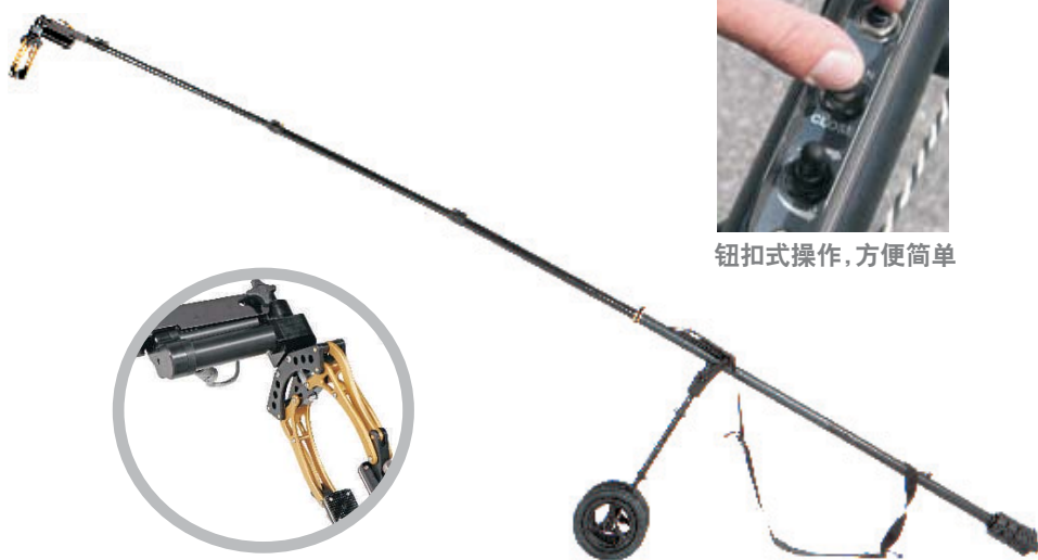
新式的轮组，提高了操控性和移动性