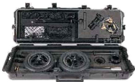
便于运输的便携箱