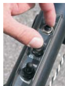
钮扣式操作，方便简单